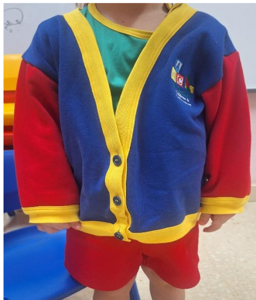
2: Uniform der Kinder