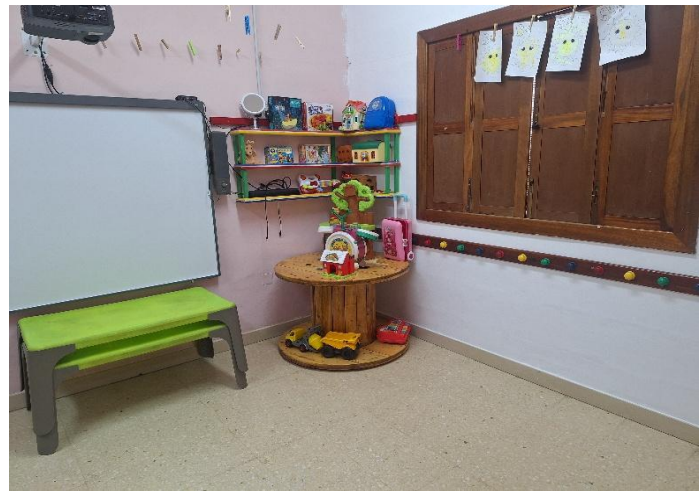
3: Gruppenraum für eine Kindergartengruppe