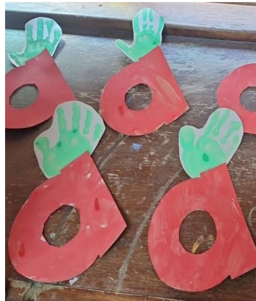
4: Lerneinheit zum Buchstaben "a"