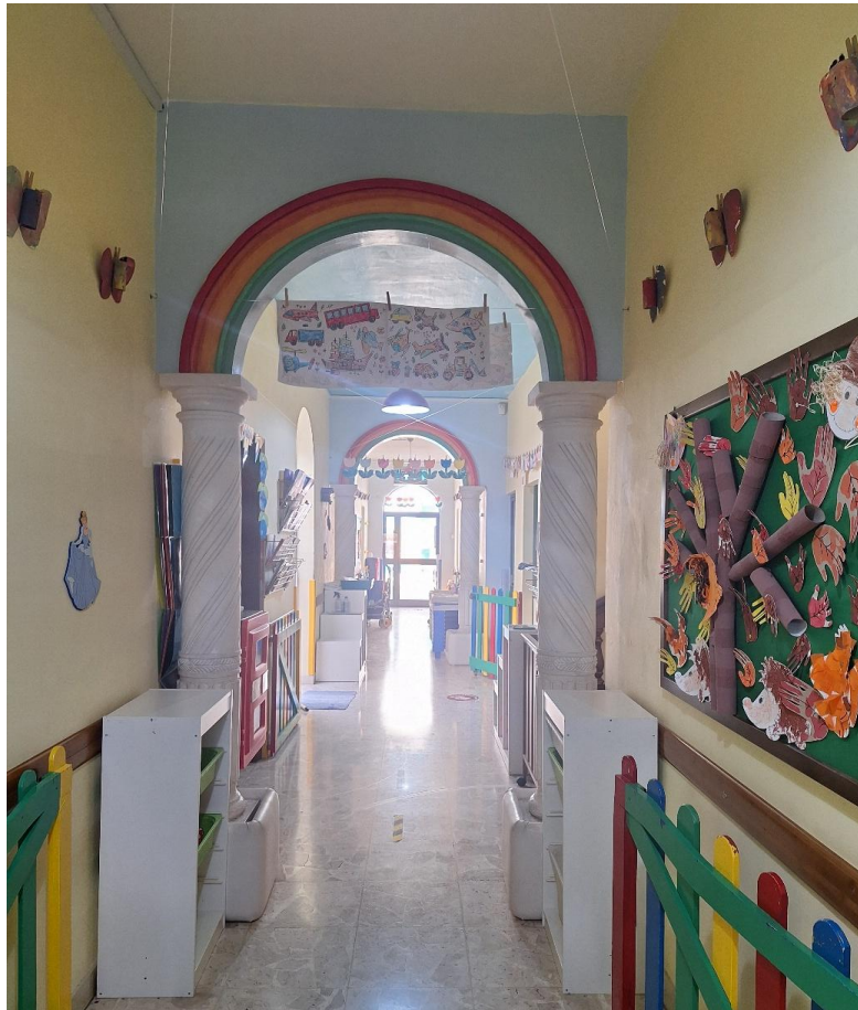
1: Liebevoll gestalteter Eingangsbereich der maltesischen Einrichtung